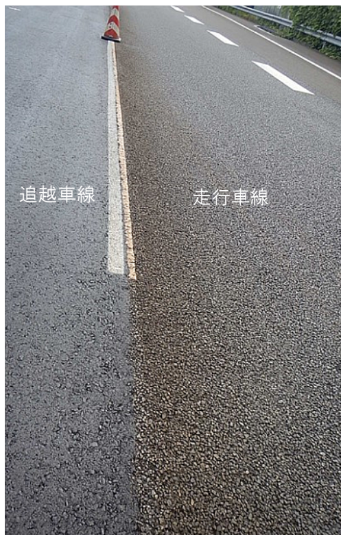
【路面状況(舗設完了後)】