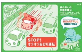
イライラ運転は思わぬ大事故に… ゆとりをもったドライブ計画を！