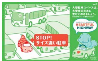
自分の車のサイズに合った 駐車マスに停めましょう！