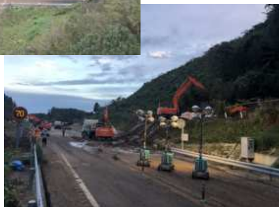
【C4】圏央道 茂原長南 IC～市原鶴舞 IC 間