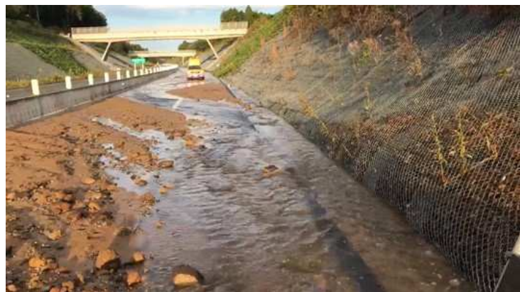
【E51】東関東道 銚田 IC～茨城空港北 IC 間