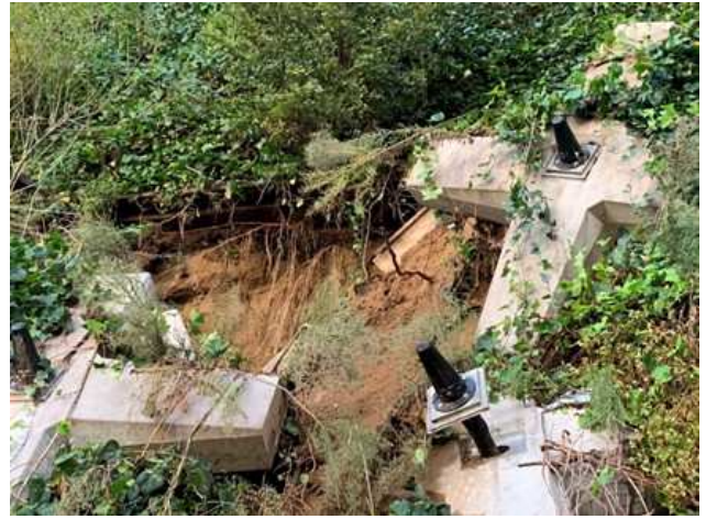
【E82】千葉東金道路 東金 JCT