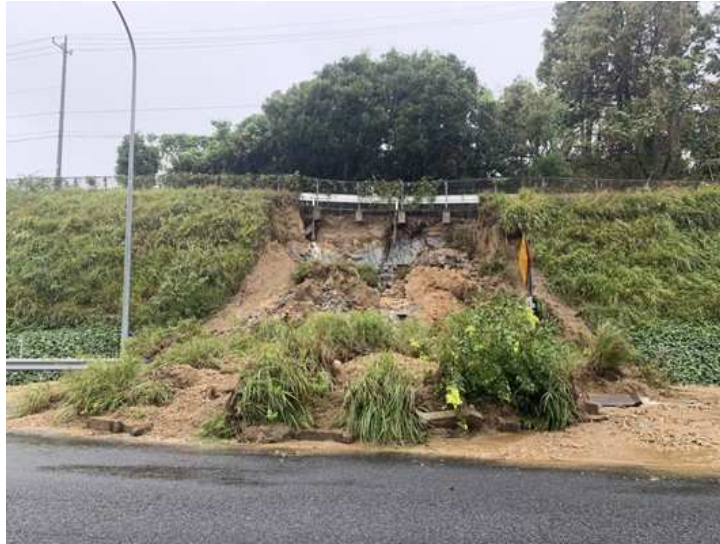
【E51】東関東道 酒々井 IC