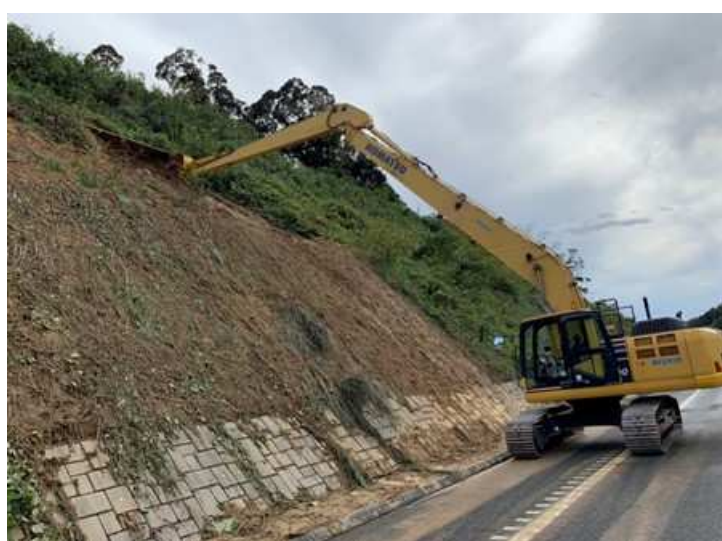
【C4】圏央道 茂原北 IC～茂原長南 IC 間