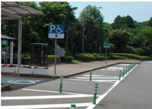
バリアフリー化前

そのため、お客さまへ極力ご迷惑をおかけしないよう、利用率が比較的少ない平日の夜間にPAの閉鎖を行い、工事を集中的かつ効率的に実施します。安全・快適に高速道路をご利用いただくために必要な工事ですので、ご理解とご協力をお願いします。