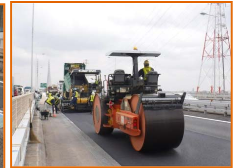
【アスファルト舗装施工状況※】