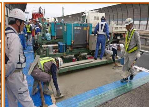
【鋼繊維補強コンクリート打設状況※】