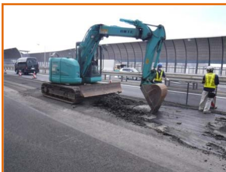
【アスファルト舗装はぎ取り状況※】