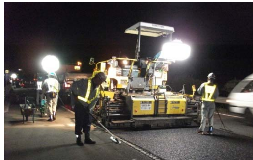
舗装補修工事 作業状況写真