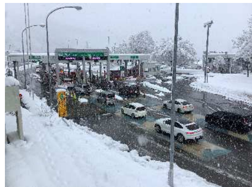
年末年始の湯沢IC出口状況(朝9時頃)