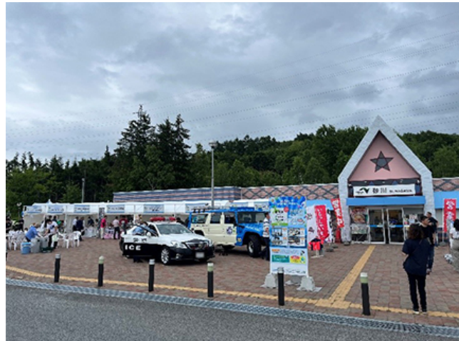
令和5年度実施の様子