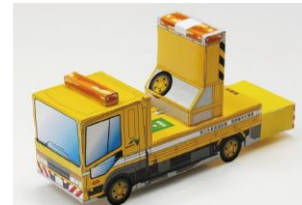
ペーパークラフト

NEXCO東日本グループでは、2021～2025年度までの期間を「SDGsの達成に貢献し、新たな未来社会に向け変革していく期間」と位置づけ、様々な取り組みを行っています。