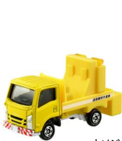
オリジナルミニカー

イベント開催中、高速道路をおトクに利用できる「イオンE-NEXCOpassカード」のご案内・入会ブースを設置します。イベント当日に「イオンE-NEXCOpassカード」にご入会いただくとNEXCO東日本オリジナルミニカーを、アンケートにご回答いただきますとペーパークラフトをそれぞれプレゼントいたします。