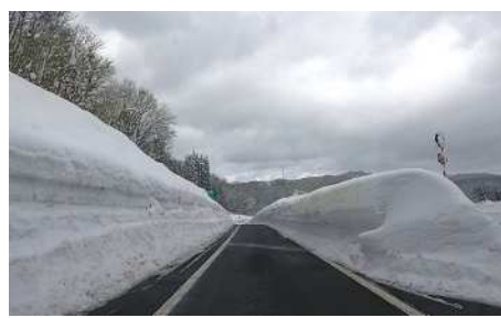
湯田ICランプの雪堤