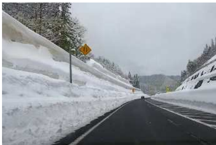
切土のり面の雪庇