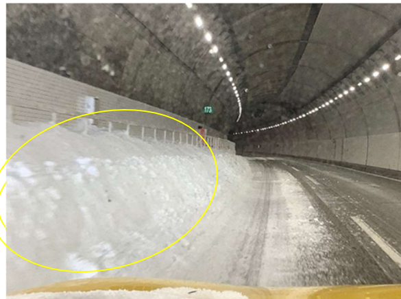
トンネル坑口付近堆雪状況