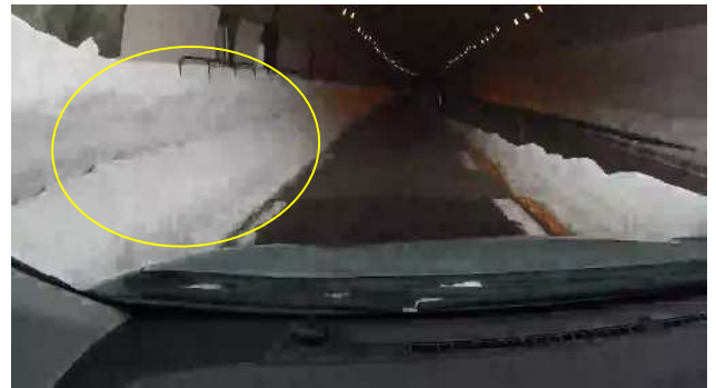
トンネル坑口付近堆雪状況