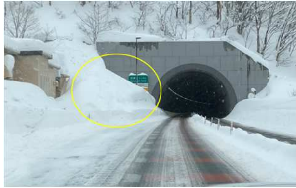
トンネル坑口雪提処理