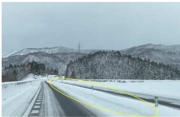
2車線区間における、中央分離帯雪提処理