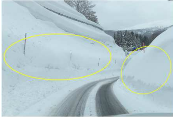
湯殿山 IC ランプの雪提処理

4. 作業内容 安全に走行していただける道路環境を維持するための除雪・排雪作業を実施します。