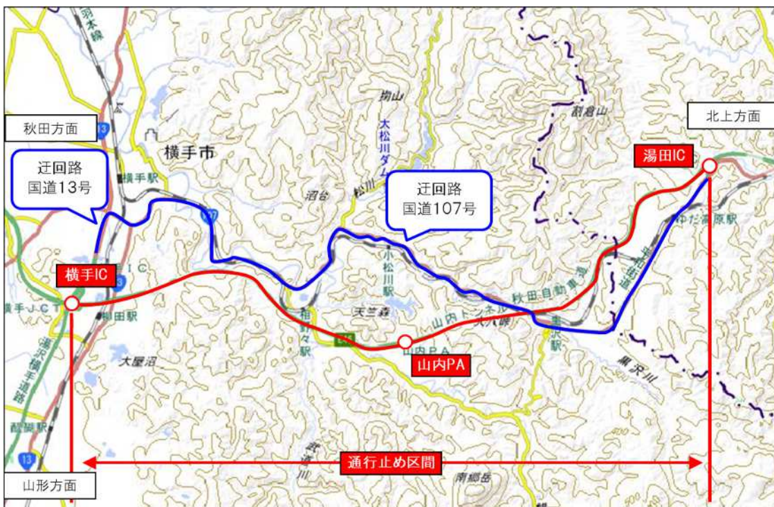
地理院地図(国土地理院)( https://maps.gsi.go.jp/ )をもとに、東日本高速道路株が加工

【通行止め区間・日時】 秋田自動車道 上下線 湯田IC～横手IC間 令和7年1月27日(月) 10時～16時