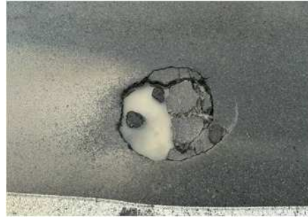
路面損傷状況(拡大)