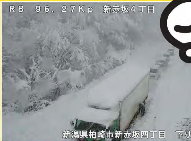
R8 96.27Kp 新赤坂4丁目