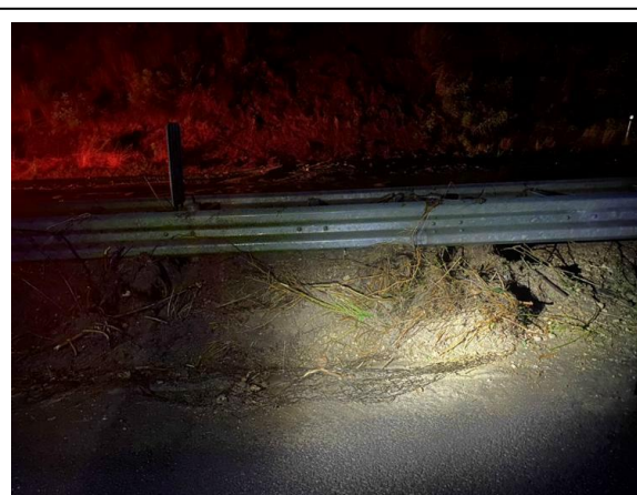
中央分離帯への土砂の堆積状況