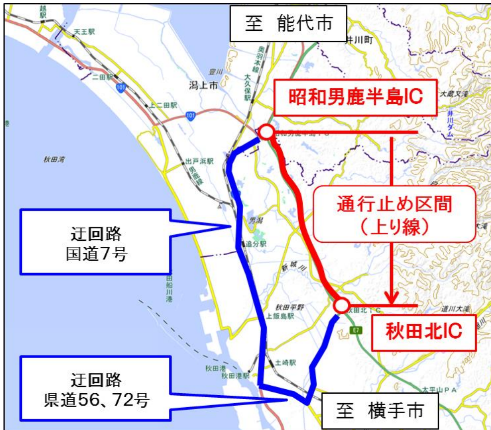
地理院地図(国土地理院)( https://maps.gsi.go.jp/ )をもとに、東日本高速道路株が加工