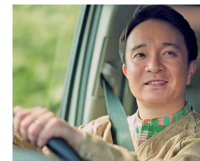
濱田 岳さんが父親役として出演する企業イメージ「『会いたい』を守る仕事 交通管理隊」篇より

お客さまをはじめ普段あまり高速道路をご利用にならない方も含めた多くの方が、濱田さんにご自身を重ね合わせて、「高速道路が[私のために役立っている]」「私の暮らしを良くしている」と期待し、親しみを感じてもらえるよう4種類の企業イメージCMを放送しています。