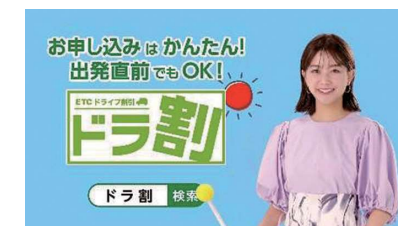
中川さんがお得な企画割引をご案内

高速道路をご利用するお客さまに対し、NEXCO東日本からのお知らせを丁寧に、わかりやすく伝えるコンシェルジェ役として中川さんを起用し、リニューアル工事ははじめ企画割引などのCMを放送しています。