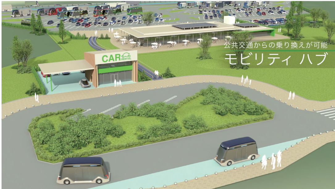
モビリティハブのイメージ