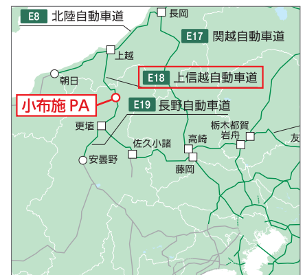
小布施 PA 位置図